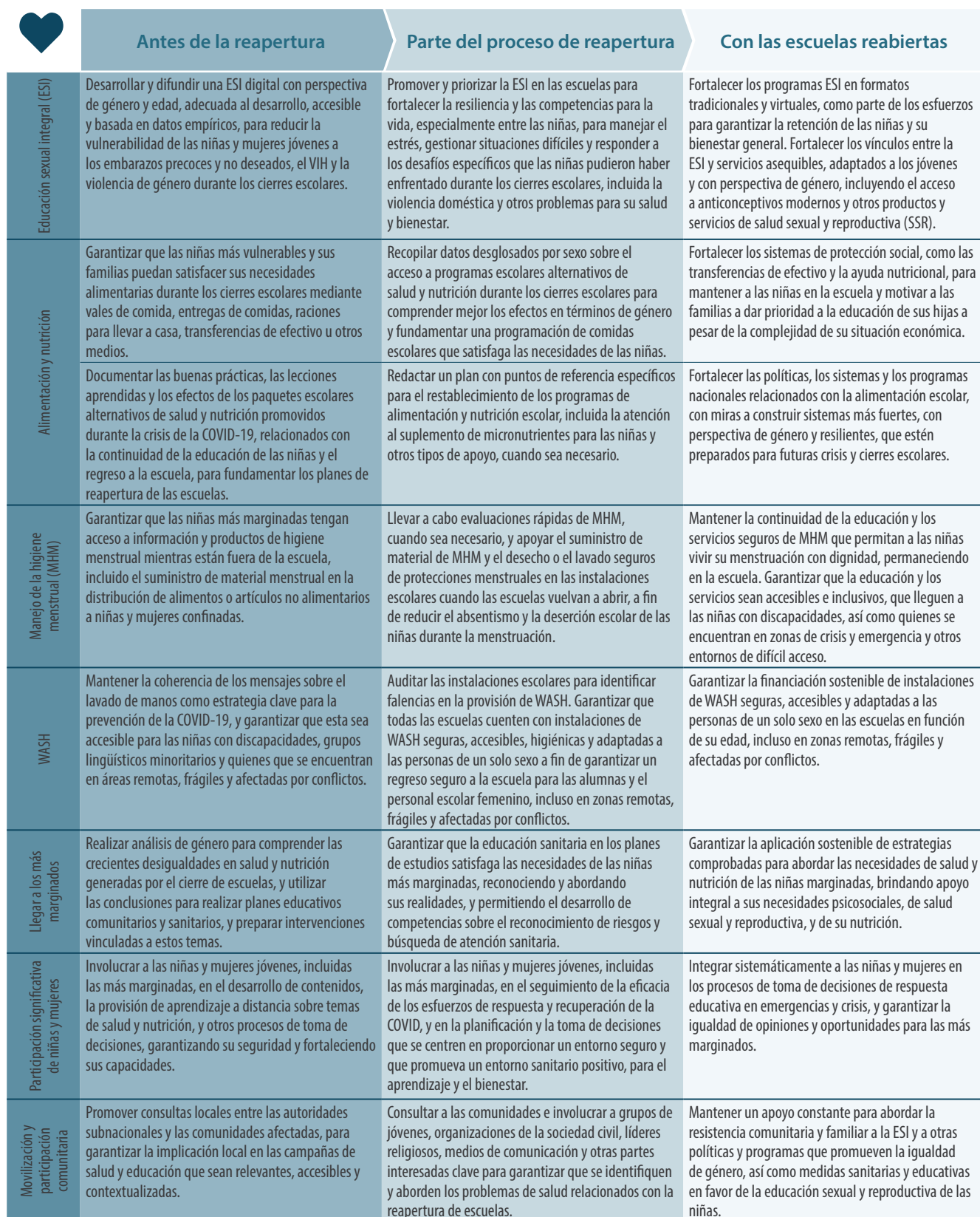
Tabla 2. Acciones recomendadas para promover la salud, la nutrición y el WASH