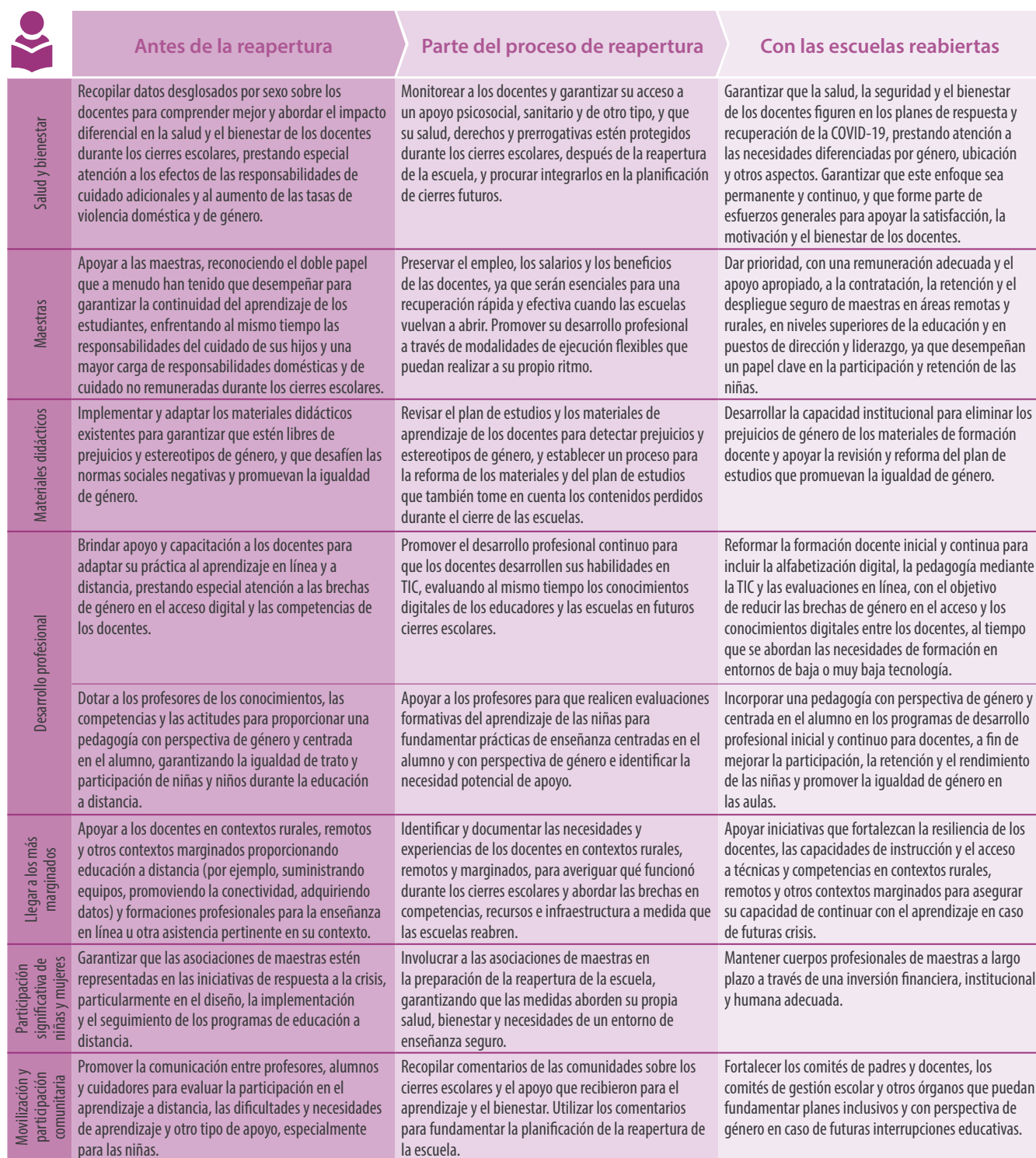
Tabla 4. Acciones recomendadas para apoyar a los docentes