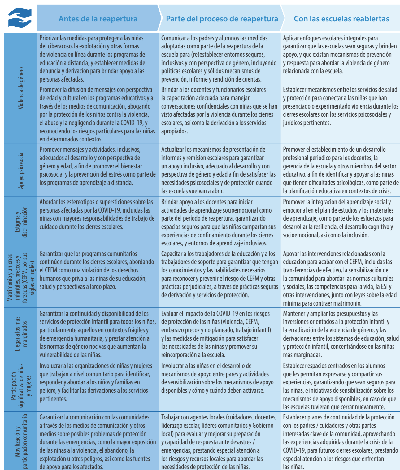
Tabla 3. Acciones recomendadas para apoyar la protección